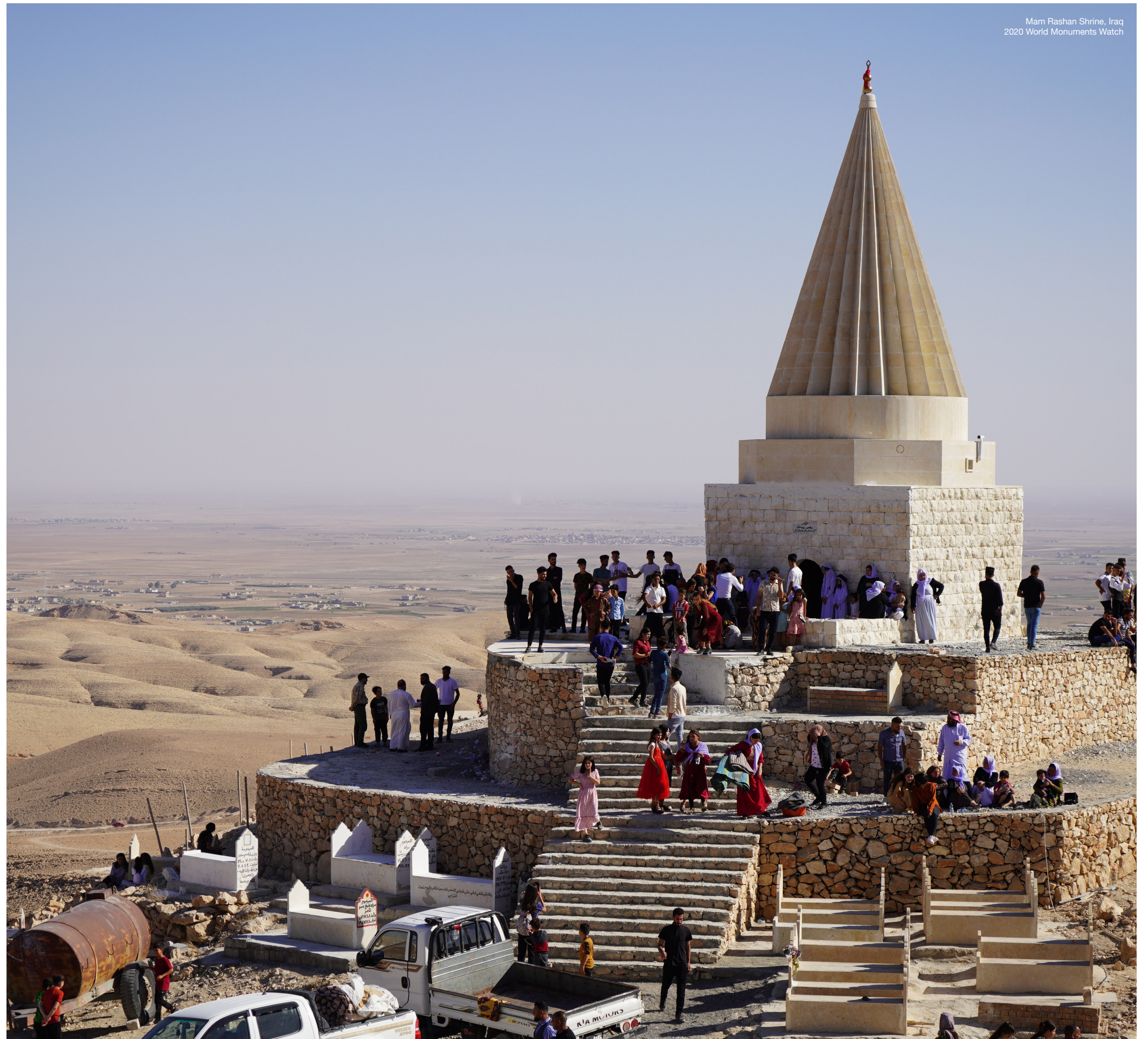
Mam Rasha Shrine, Iraq 2020 World Monuments Watch