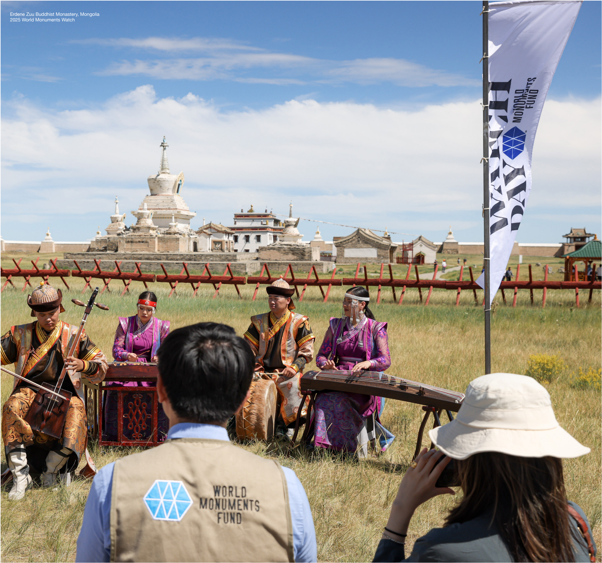
Erdene Zuu Buddhist Monastery, Mongolia 2025 World Monuments Watch