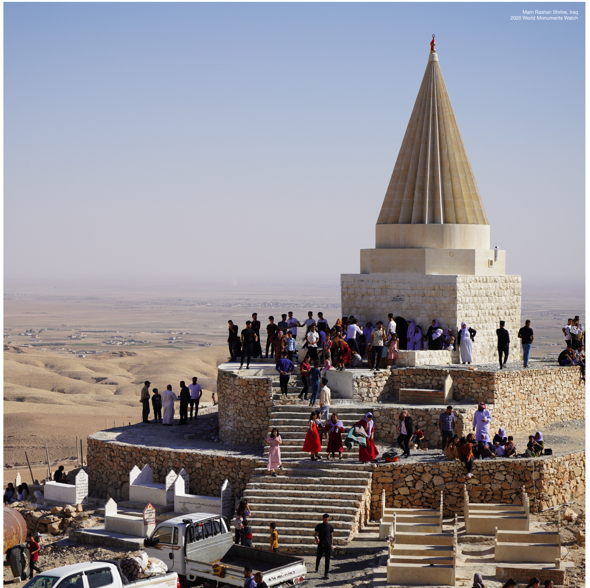
Mam Rasha Shrine, Iraq 2020 World Monuments Watch