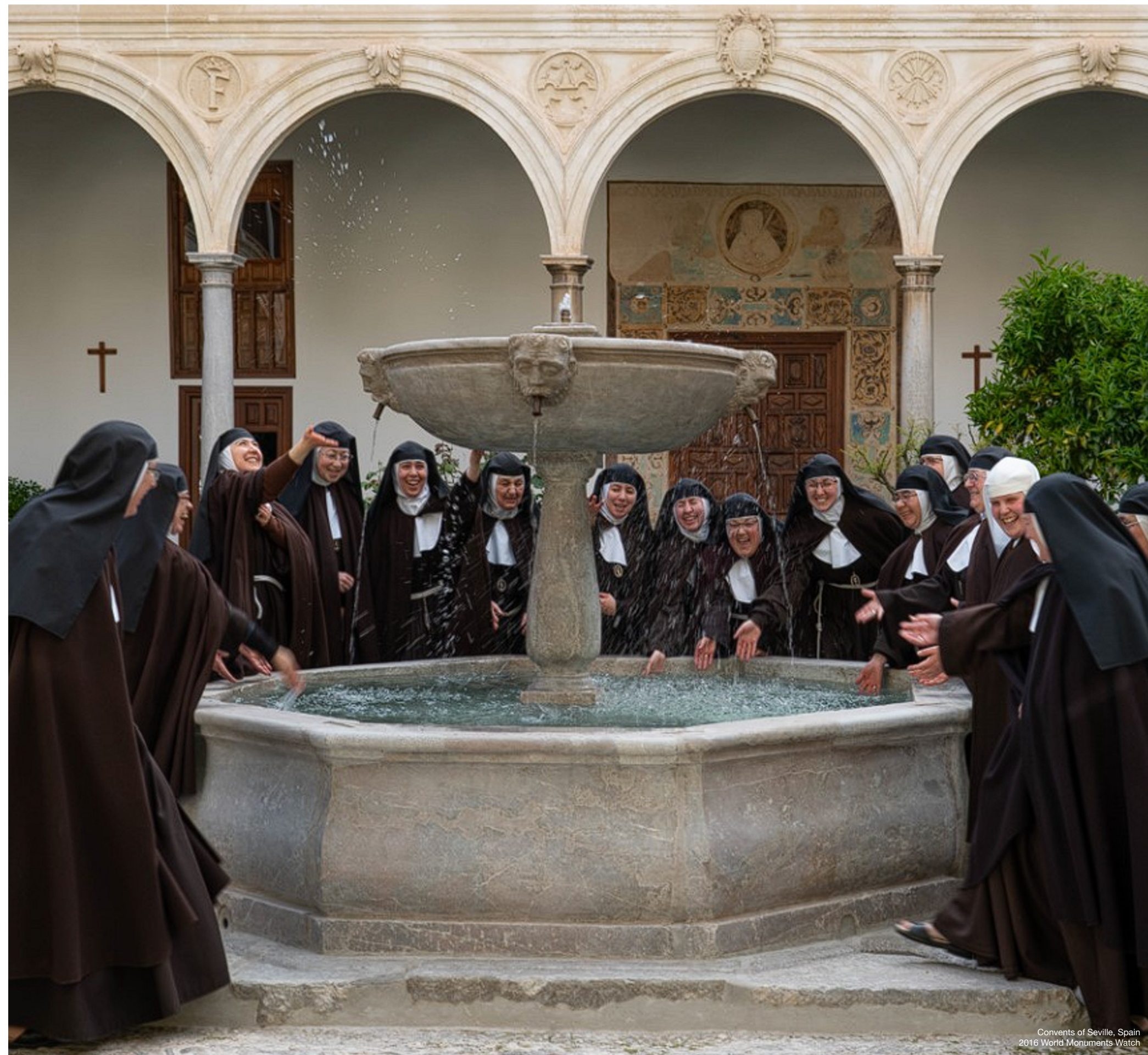
Convents of Seville, Spain 2016 World Monuments Watch

Il sostegno del proprietario legale del sito è auspicato, ma non indispensabile. Nei casi pertinenti, il WMF informerà i proprietari prima dell'annuncio pubblico del Watch 2027.