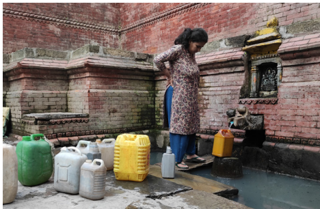
尼泊尔: 加德满都谷地的 hitis

这座纪念亚兹迪圣徒Mam Rashaan的神庙在 2014 年被所谓的“伊斯兰国”(亦称 ISIS) 摧毁后, 由Eyzidi文档组织提名列入 2020 年Watch。通过Watch, WMF与当地合作伙伴紧密合作, 重建了Mam Rashaan神庙, 使之再度成为亚兹迪社区的宗教与仪式中心, 彰显了文化遗产在冲突后复苏的强大力量。