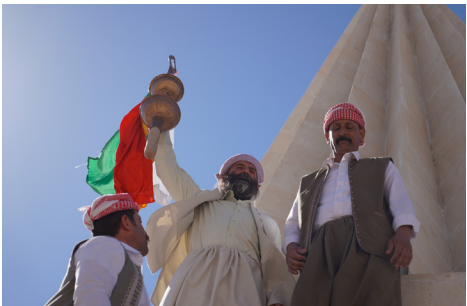
伊拉克: Mam Rashaan 神庙

这座 17 世纪建筑地标位于巴黎市中心, 因暴雨损毁已关闭二十余年。该遗产地列入 2025 年 Watch, 旨在推动其修复并重新开放。通过Watch, WMF与巴黎大学公署及城市当局建立合作, 推进修复工作, 使教堂重归公共使用, 并重新融入巴黎的文化与学术生活。