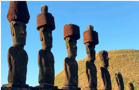
智利: 拉帕努伊 (复活节岛)

这一文化景观以独特的土建筑闻名, 由Corps de Volontaires Béninois提名, 列入2020 年 Watch。此后, WMF与当地工匠及社区成员合作, 保护这些建筑并向新一代建筑者传授传统建造技艺。为了确保木材的可持续性供应, 该项目共种植5,000棵树, 并支持女性团体将其在建筑领域的传统角色与经济独立的新机遇相结合。