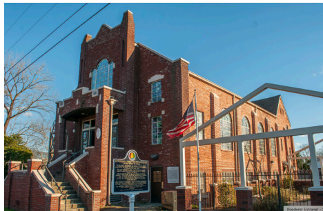
美国: 阿拉巴马州民权遗址

被称为hitis的传统喷泉, 其历史可追溯到公元六世纪, 至今仍为加德满都谷地 20% 的居民提供水源, 对缺乏可靠饮用水的人群至关重要。该遗产地由当地组织Chiva Chaitya Organization提名, 并成功列入 2022 年Watch, 凸显了hitis在应对因气候变化加剧的水资源危机中的重要作用。WMF目前正与当地合作伙伴合作, 对hitis进行研究与修复, 以供社区继续使用, 从而提高人们对其在加德满都谷地当今生活中价值的认识。