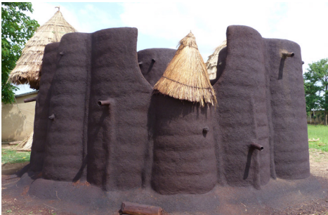
贝宁和多哥: 古帕玛库, 巴塔马利巴人之地

自 1996 年以来, Watch已聚焦全球136个国家的近900处遗产地, 覆盖各大洲。